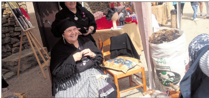
Los organizadores intentan recuperar trabajos y prácticas de la zona.