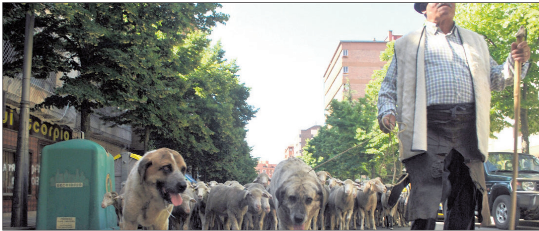
La fiesta de La Trashumancia atrae cada año a un gran número de visitantes. /J.J.A.